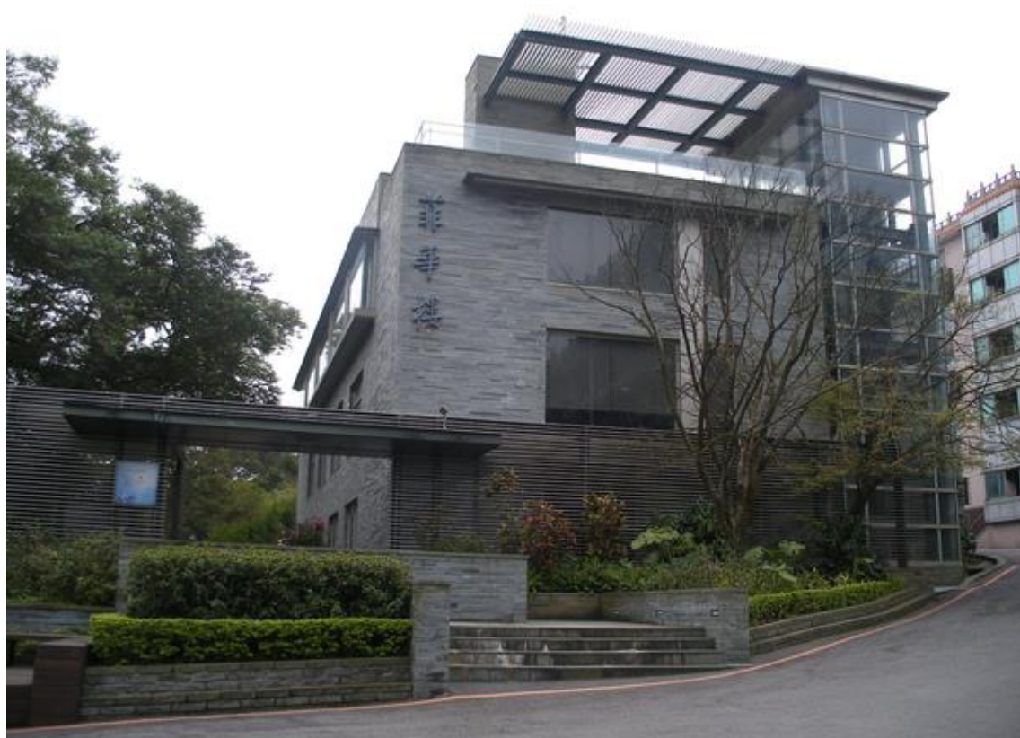
圖 2. 中國文化大學校園與菲華樓