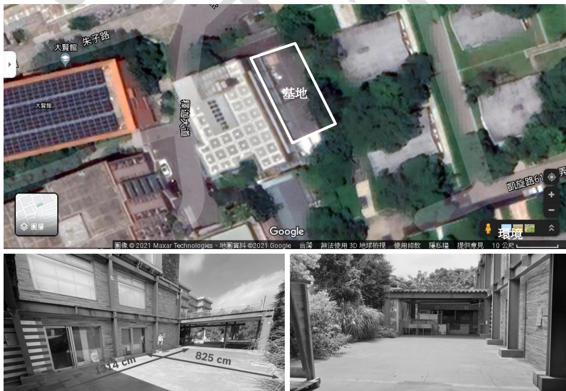
圖 1. 本設計以菲華樓旁的空地為建築基地（白框區域）；實際操作範圍由各組協調後確認。

本設計要求每位學生先發展出自己的工作小屋，再以組為單位，與組員共同配置出建築群體與公共空間。進言之，每個工作小屋都可單獨成立，也必須能與其他組員的小屋組合為一個建築群體，並且合併後不僅要保有各自小屋特色，更要能透過建築群體配置與開放空間營造，打造文大建築市集；該建築市集，除了是文大建築系師生的教學與研究場域，同時也歡迎文大其它系所師生使用，回應文大跨域專長。