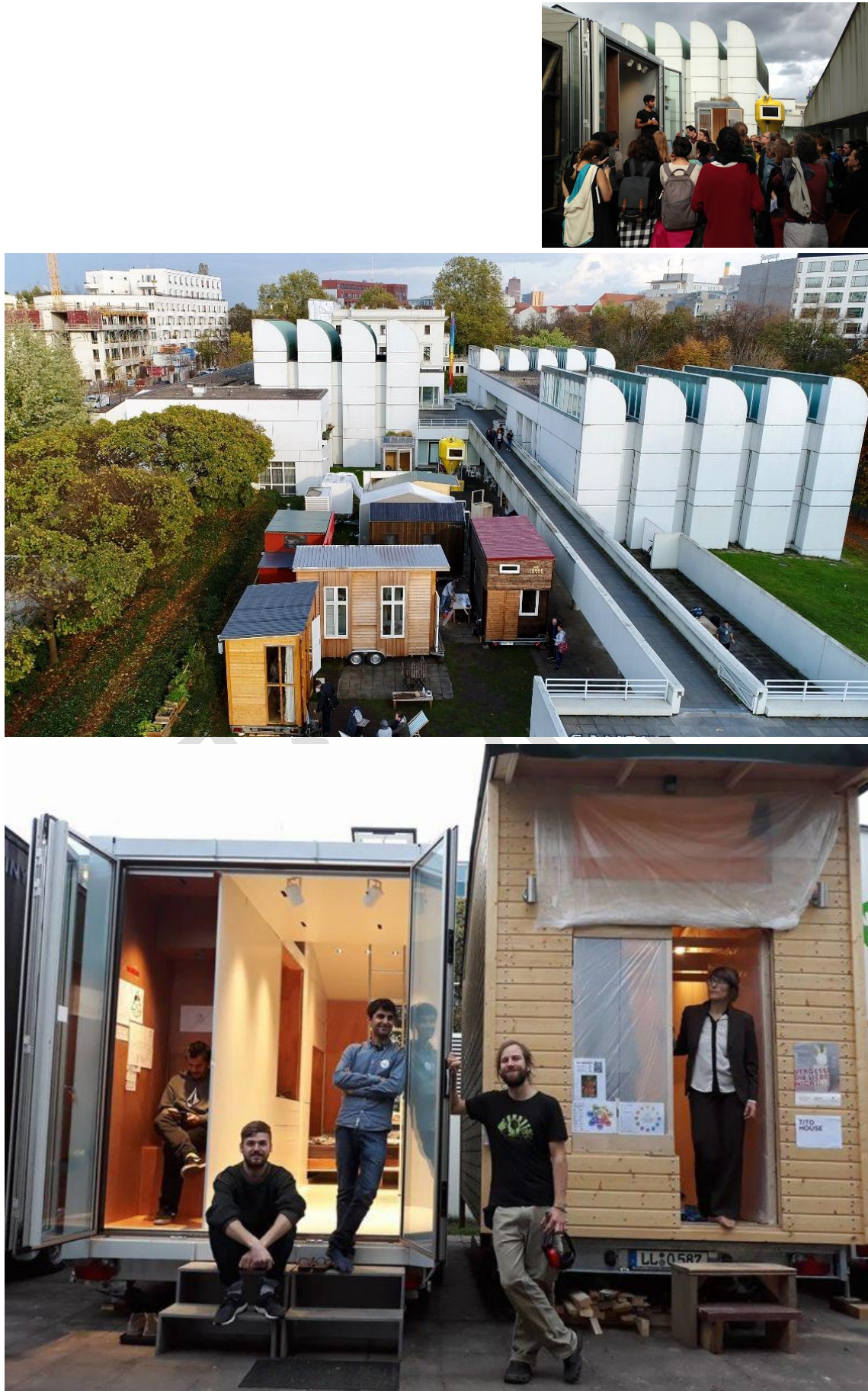
圖 2b. 德國 Bauhaus Campus Berlin. http://www.leonardodichiara.it/bauhaus-campus-berlin/